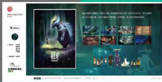
- 德國紅點設計獎獲獎作品