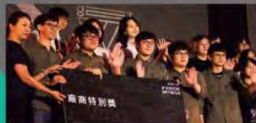
學生作品「調情師」屢創佳績，榮獲放視大賞